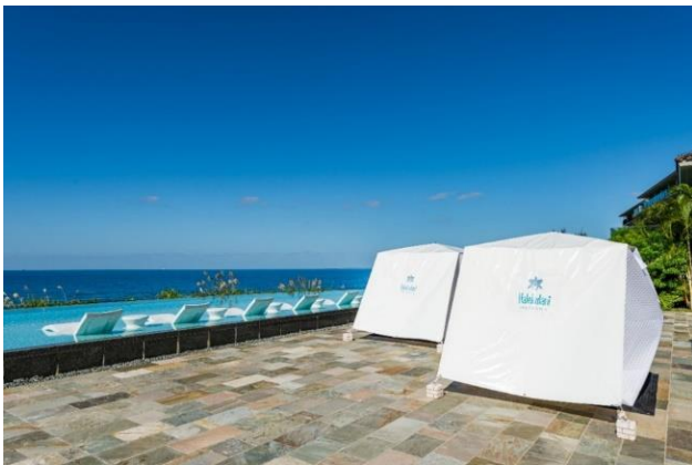
テントサウナイメージ

今日、ウェルネスの分野で注目され、新しいリラクゼーションの“カタチ”のひとつとして定着しつつある「サウナ」。全身の血流が促進されることにより、健康・美容面での効能や自律神経を整え、高いリラックス効果が期待できるといわれています。