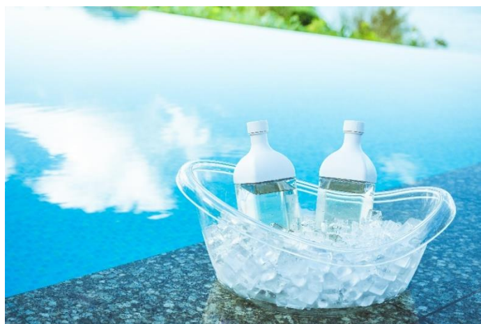
特製サウナドリンク イメージ

なお、テントサウナをご利用は1張りにつき最大3名様まで、1回あたりのご予約で1時間30分お使いいただけますので、お客様それぞれのご滞在スケジュール、スタイルで、心ゆくまでサウナ体験をお楽しみください。